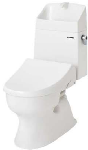
温水洗浄便座タイプ