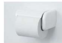
ワンタッチ式紙巻器 ワンタッチカミマキT BW1