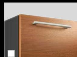
C:ロイディアムウッド 取っ手:ラウンド(シルバー)