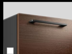
M:ロイダルブラウン 取っ手:スクエア(ブラック)