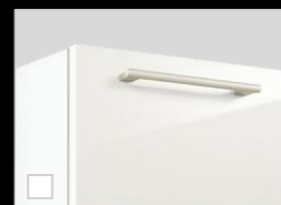
W:パナジェホワイト 取っ手:ラウンド(シルバー)